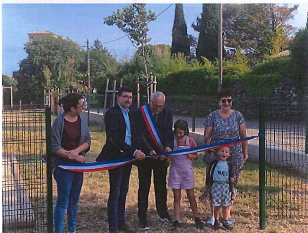
La partie Officielle