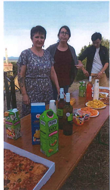
Les porteuses de projet...