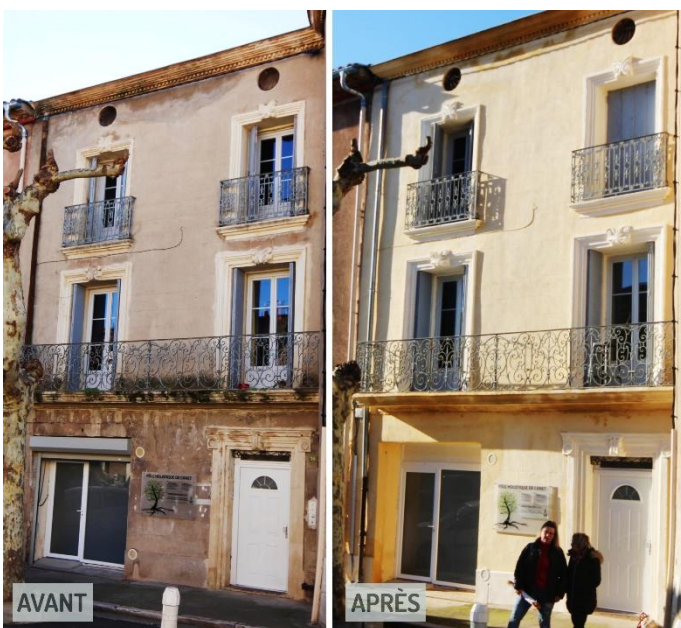
Bâtiment ayant bénéficié du Plan Rénovation Façades à Canet